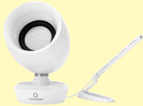
卓上型会話支援システム comuoon SE 開発・製造ユニバーサル・サウンドデザイン

大和ハウス工業は、これまで住宅（戸建住宅・賃貸住宅・分譲マンション）150万戸超、商業施設3万6千棟以上、医療・介護施設5千棟以上を供給し、「人・街・暮らしの価値共創グループ」として、「ア（安全・安心）・ス（スピード・ストック）・フ（福祉）・カ（環境）・ケ（健康）・ツ（通信）・ノ（農業）」をキーワードとした経営の多角化にも積極的に挑戦しており、「プラス2、プラス3の事業」の創出に努めています。介護職員の腰痛予防や排泄介護の負担軽減、認知症の方のQOL向上、難聴者への聞こえや施設内の衛生改善など、おもに「フ（福祉）」の分野でお客様の「お困りごと」を解決するために提案しているロボット福祉機器を展示します。