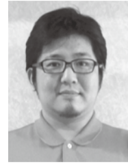
千葉県八千代市 社会福祉法人清明会 ケアハウスガーデンカルミア

今後は、これまで取得してきた資格の知識や経験を活かして、介護福祉事業の経営に関わっていきたくと思います。そのなかでも、私が特に力を入れていきたいのは、介護人材の獲得・育成が円滑に行える仕組み作りです。この仕組み作りを通じて職員と成功例や失敗例を共有していく、一つの形にしていきたいと思っています。