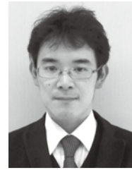
神奈川横浜市中企業診断士

「介護福祉経営士2級」はこれまで、計6回の資格認定試験で、総勢812名の合格者が誕生しました。介護施設・事業所・企業などから多くの方々が受験し、合格しています。どのような目的で受験し、どのように「介護福祉経営士」の資格を業務に活かそうと考えているのか、合格者の皆様にお話を聞きました。