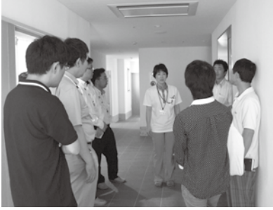
施設の説明を受ける受講者（東海会場）