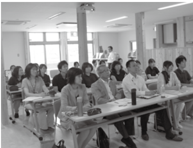
保育士と合同で講習を受ける受講者（前列左）（北信越会場）