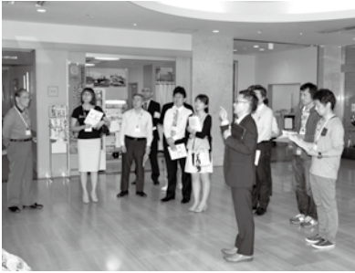
「ローズコミュニティ・緑地」を見学（関西会場）