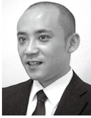
技研商事インターナショナル株式会社 マーケティング部長 東京都千代田区