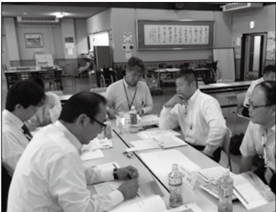
グループワークで活発な意見を交換（九州会場）