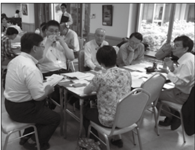
法人幹部も交えてグループワークを実施（関東会場）