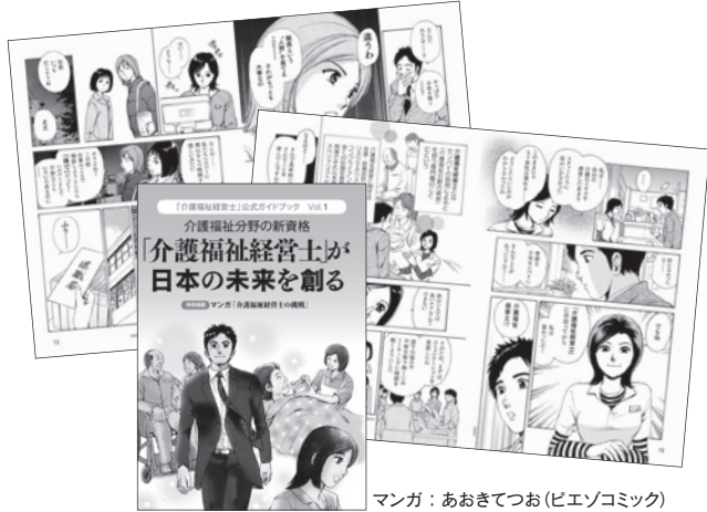
マンガ：あおきてつお(ピエソコミック)

ご希望の方は当協会までご連絡ください。なお、マンガは協会ホームページでもお読みいただけます。