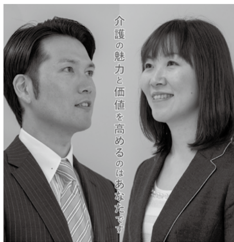
介護の魅力と価値を高めるのはあなたです

同会は、今年度の「介護福祉経営士」ポスターを作成配布している(左参照)。事業所・企業内に掲出して「介護福祉経営士」の案内に活用できるもので、サイズはA2判とA4判の2種類。希望者は送付先および希望サイズをE-mailにてお送りください。 ■お問合せ 一般社団法人日本介護福祉経営人材教育協会 電話03-3256-0571 E-mail: info@nkfk.jp