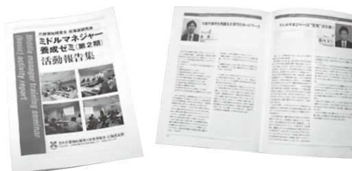
北海道支部研究会では毎回活動報告集を制作している。本ゼミのものは現在制作中