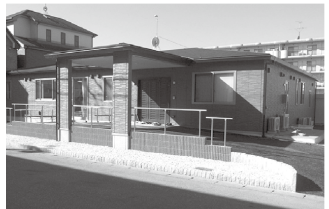
周辺地域の同社の訪問介護の事業所やグループホームと連携していく

供することが難しいと感じていた参加者は、興味深くフード担当者の説明に耳を傾けていた。