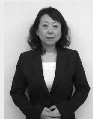
オーロラ・ケアネット株式会社取締役 介護福祉経営士1級

また、社会保障を軸としながらも、フレキシブルな北海道支部の他のセミナーとリンクする講義でもあり、単独でも組み合わせても、個人のニーズに合わせた受講ができることも本セミナーの魅力の1つだと思います。