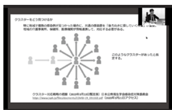
セミナー画面の様子(第1部)

会員制コミュニケーションサロン。全国の介護事業経営者が、さまざまな課題についてホンネで共有し、解決にむけて実践的な方策を探る場として誕生しました。